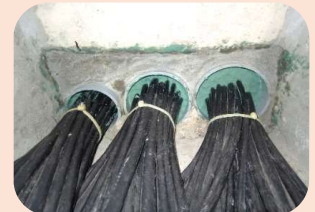
【開口部浸水対策工法】

国土交通省 新技術情報提供システム NETIS VTC(建設技術情報提供システム)登録製品 登録番号 KT-230237-A