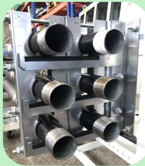
【多段配管支持金物】